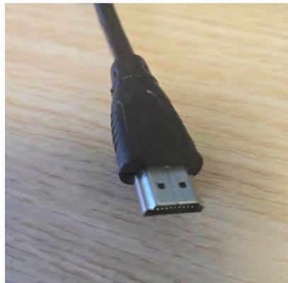
Cable HDMI (Côté Ecran ET Côté Dock)