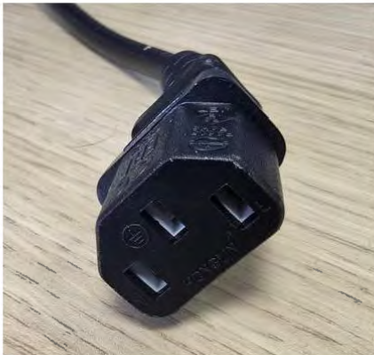
Cable Alimentation (côté Ecran)