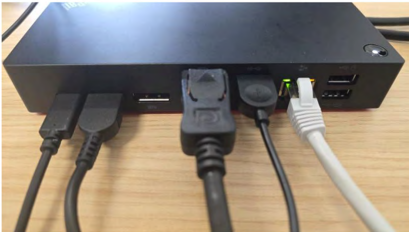
Connectiques à l'arrière du dock

(NB : Le cable Réseau ici en blanc est facultatif si le PC est connecté à Internet en WIFI)