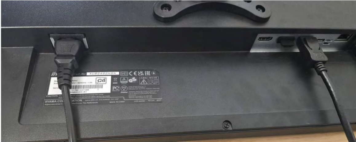
Connectiques à l'arrière de l'écran

Vérifier que les câbles sont correctement connectés à l'arrière de l'écran et du dock, et que le dock est alimenté.